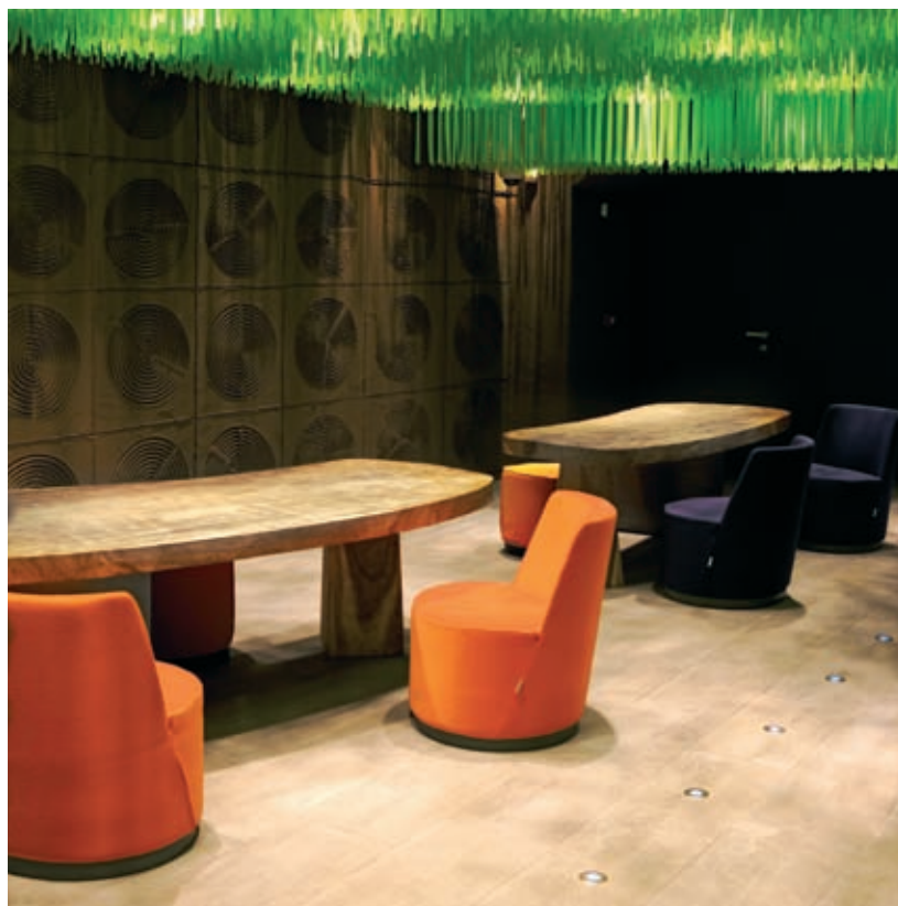
↙ ↓ ↑ Dodo Show Room, Firenze, 2008