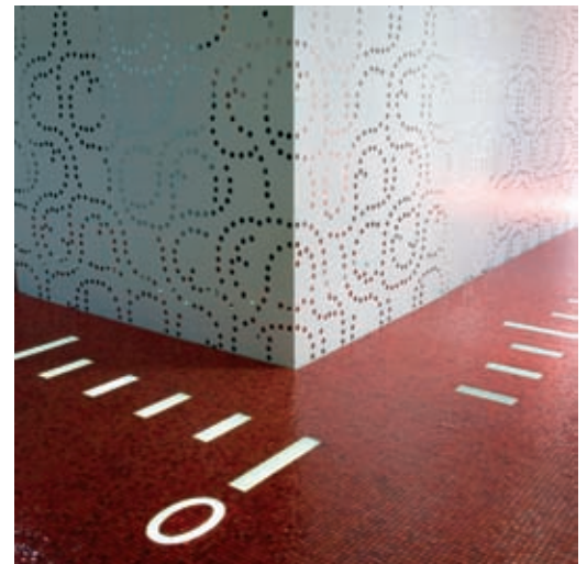
↙ ↖ ↑ Art Trading Office , Mosca, 2007