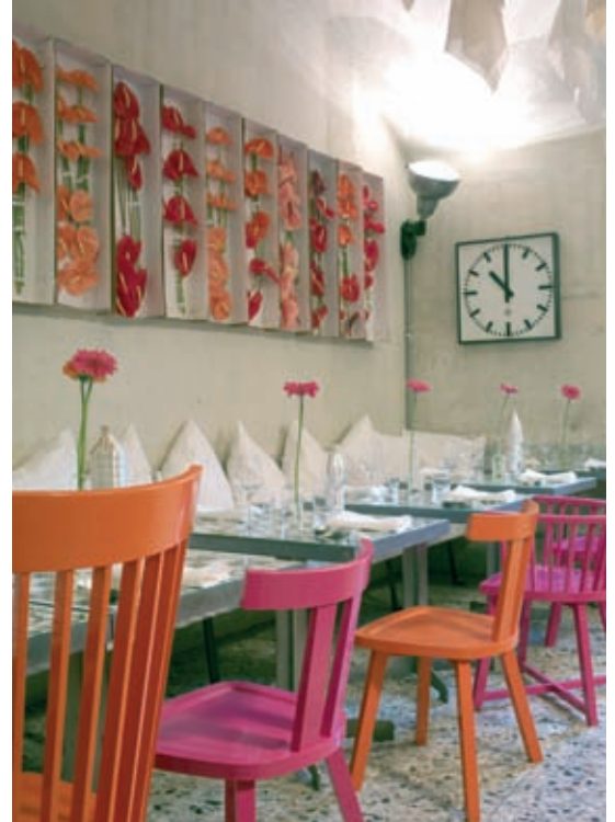
↖ ↗ ↘ Pane e Acqua Restaurant, Milano, Salone del Mobile 2008